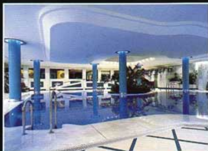
Club Playas del Duque Sport - Center