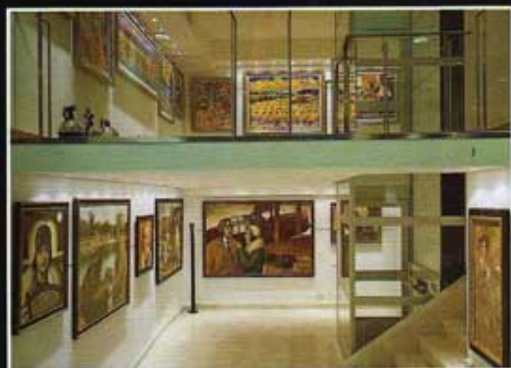
Sammer Gallery Contemporary Art