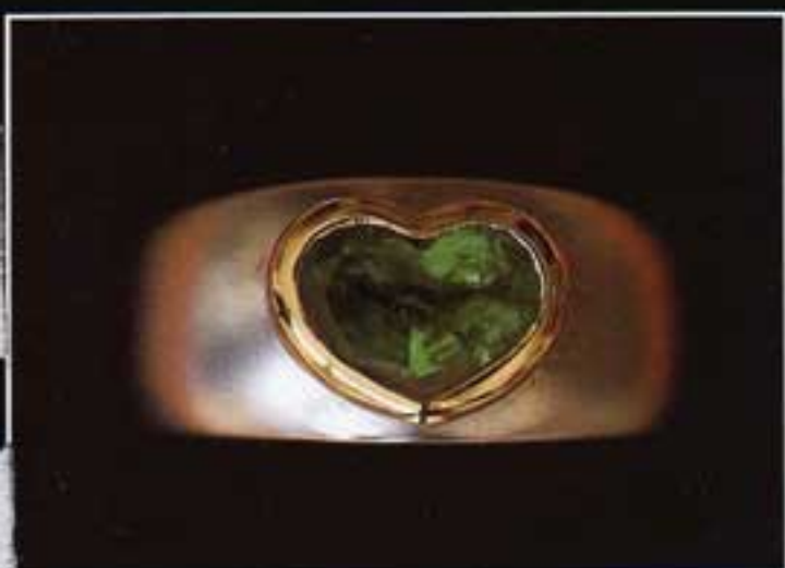
Amazon Gems & Grystals