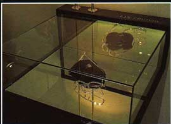
Eye Couture Glasses Boutique