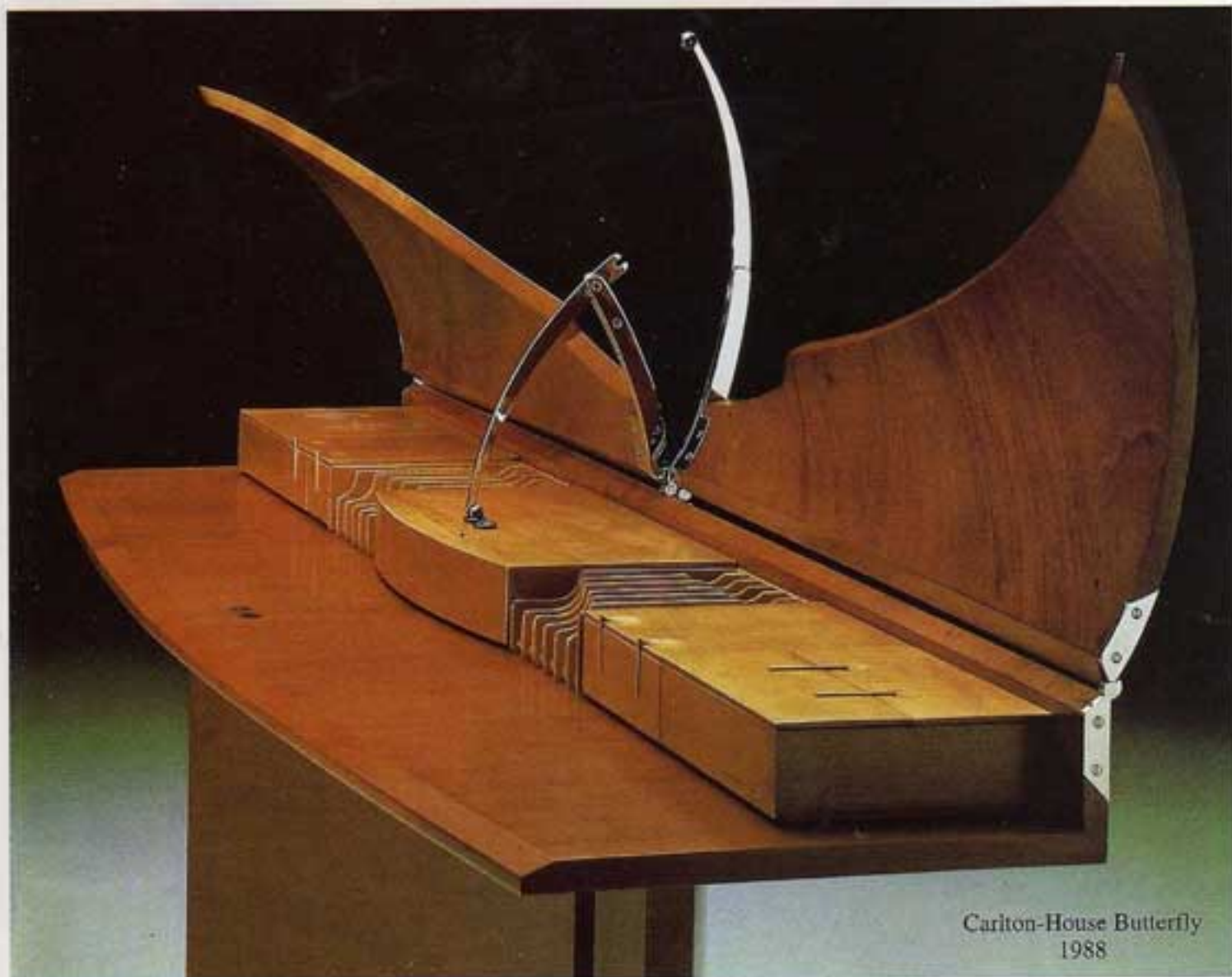
Cariton-House Butterfly 1988