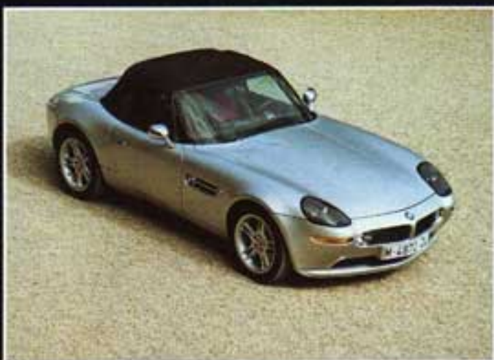
BMW Z8 James Bond Car