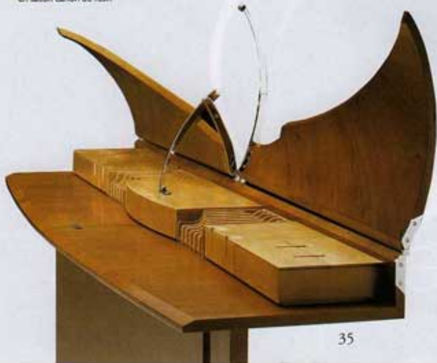
"Carlton-house Butterfly". Console en noyer, intérieur en sycomore. Finition en vernis clair. Ferrures en nickel avec détails en laiton canon de fusil.