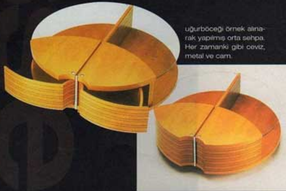
uğurböceği örnek alınarak yapılmış orta sehpa. Her zamanki gibi ceviz, metal ve cam.