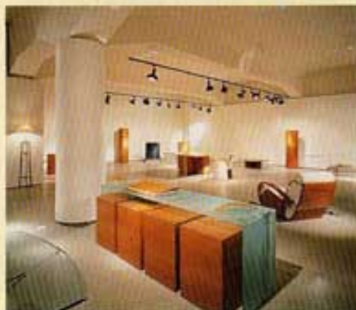
Showroom Tresserra (Jaume Tresserra).