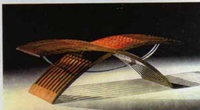
ARriba: elegante mesa de despacho denominada "Paralelas". La madera es de nogal barnizado, el porta-objetos de cristal tallado y los herrajes cromados. En el lateral una original cartera de pekary para guardar documentos. Abajo: banqueta "Gavina", madera de mongoy. Los metales son cromados.

¿Cuál es el papel que representan los muebles en un hogar?