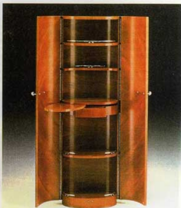
Detalle abierto del mueble bar "Elíptico". Los compartimentos están pensados para conjugar belleza y funcionalidad. Un ejemplo de ello es la bandeja móvil del centro, que queda escondida cuando no se utiliza.

ses «invaden» este espacio que ya incluyen en los itinerarios culturales de Barcelona, al igual que visitan la Sagrada Familia o el Parque Güell. Y por si fuera poco, algunas de las creaciones de Tresserra se han hecho famosas en todo el mundo a través de las pantallas. Una de las películas más taquilleras — Batman — cuenta con varios muebles de Tresserra para crear ese ambiente moderno y sofisticado que la distingue.