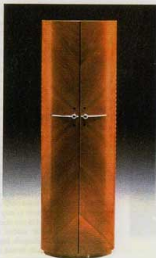
Mueble bar modelo "Elíptico" en madera de nogal y barnizado en oscuro. Los herrajes acabados en plata y cuero. Sus medidas son 50 x 30 x 165 cm.