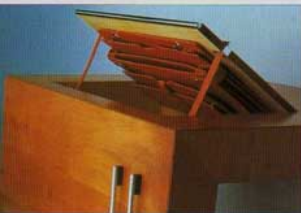
El nogal blanco español es la madera preferida por Jaime Tresserra para sus creaciones, dentro de un hacer depurado y rudo a la vez, racionalista y cálido

sualidad, simplicidad en el dibujo y confortabilidad en el tacto porque debían ser muebles para ser tocados». Su filosofía creativa siempre se ha basado en buscar el placer de lo estético y en el desprecio por todo lo que suponga masificación. Desde un principio Tresserra ha rechazado los condicionantes industriales, «en los que tantas veces la belleza se pierde en busca de la máxima rentabilidad. Para mí la prioridad está en el sentido estético, aunque es evidente que todo mueble debe ser práctico, por lo que también debo de aplicar el sentido común y el racionalismo». Por ello, fiel a este compromiso estético, «escogí como soporte para dar forma a mis diseños, la complicidad del buen hacer artesanal y los materiales más nobles. Y está claro que en mi colección nadie encontrará un mueble cien por cien práctico». Muebles dotados de una sorprendente personalidad, en cuyo proceso de elaboración, desde que se preparan las primeras maderas hasta que se da el último toque, se puede tardar hasta cuatro meses.